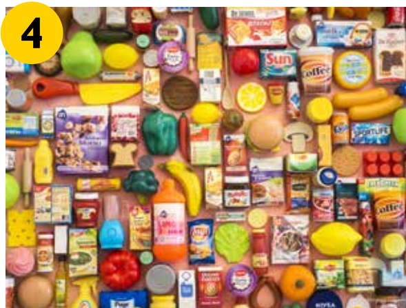
Jan Henderikse, Eten I, 2017

Enthousiast? Deel via de app uw favoriete fragment op sociale media!