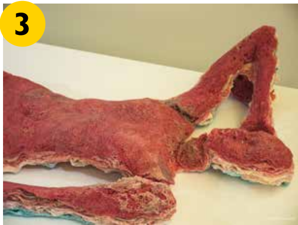
Martine Poot, Treacherous Sweet, 2017/2018