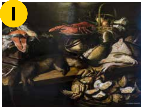
Frans Snijders, Stilleven met vis, groenten en otter, 1610