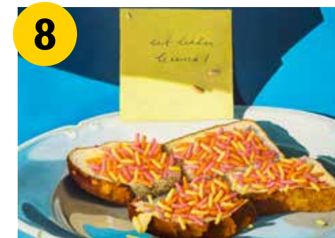
Elvira Dik, Fab Four, 2015